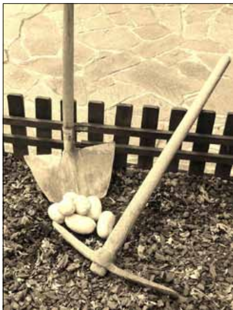
Matteo Zappa - “I frutti della fatica”