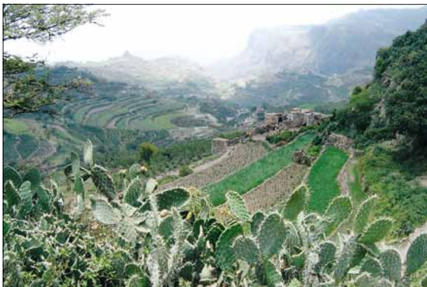
Matteo Zappa - “Coltivazioni a terrazza”