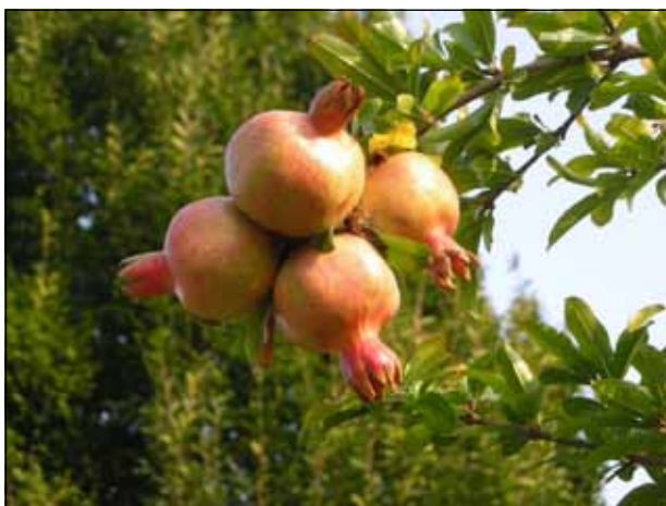
Matteo Zappa - “Frutto ornamentale”