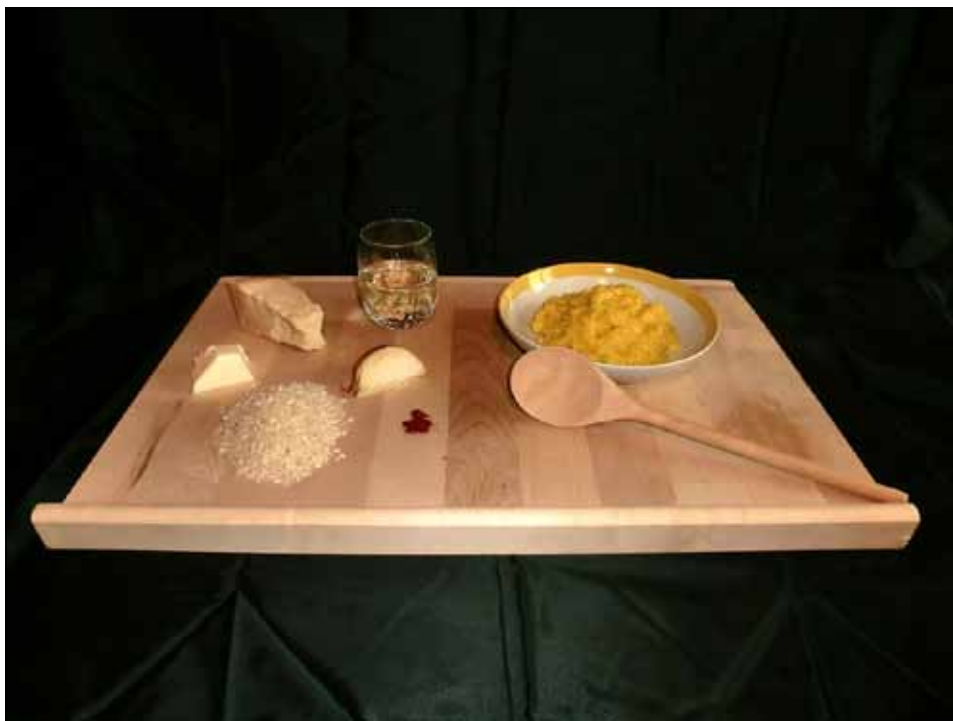
Matteo Zappa - “Viva la tradizione”