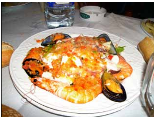
Matteo Zappa - “Prelibatezza spagnola”