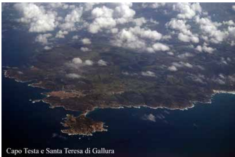
Capo Testa e Santa Teresa di Gallura

'...la paura in fondo mi da sempre un gusto strano...' cantava l'indimenticabile Lucio Dalla ed io, quel gusto lo provo tutte le volte che mi allaccio la cintura di sicurezza sul sedile di un aereo e posso garantire che più che strano è terribile. E quante volte ormai ci sono salito! Avrò più di tremila ore di volo (4 mesi della mia vita nel panico) atterraggi d'emergenza, voli transoceanici senza mai poter slacciare le cinture, mettendo a dura prova le vesciche di tutti i passeggeri, fulmini presi in volo eppure, nonostante sia un veterano che ne ha viste di tutti i colori, la paura mi attanaglia tutte le volte: salivazione azzerata, sudorazione copiosa,