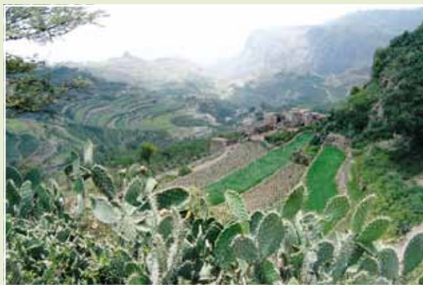
Matteo Zappa - “Coltivazioni a terrazza”

- per aver proposto le coltivazioni attraverso affascinanti geometrie paesaggistiche.