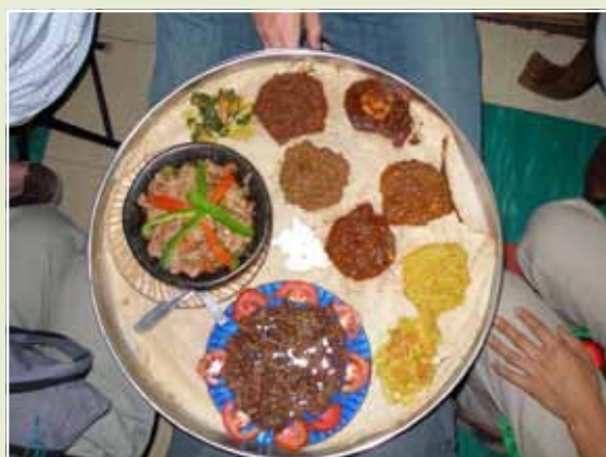
Matteo Zappa “La tavola rotonda etiopese”