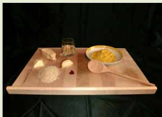
Matteo Zappa - “Viva la tradizione”