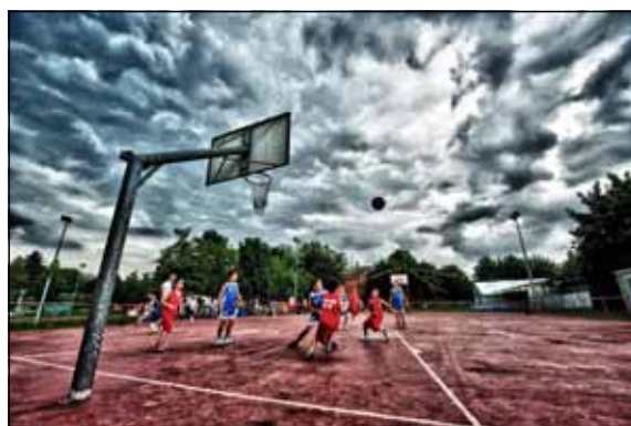
WALTER TURCATO - GFSP 3° - Punti 37