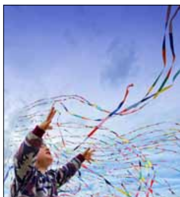
UBALDO MANTEGAZZA - GFG 1° e.a. - Punti 38